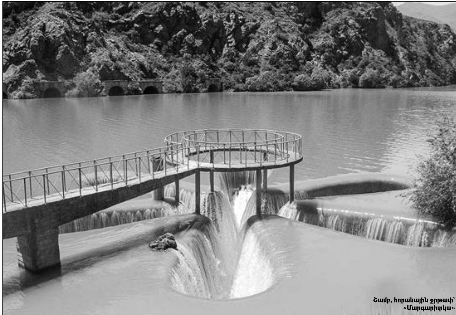
Շամբ, հորանային ջրթափ՝ «Մարգարիտկա»