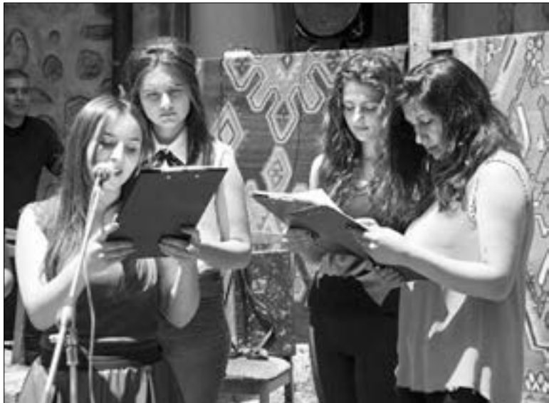
Յուրերը գրողի բյուրեղային սրբազնագործությունների բույրն ու հմայքը մեկ անգամ եւս վայելեցին «Միրիադ» գրական ակումբի շնորհիվ, որ հանդես եկավ Բակունցի գրական դիմանկարն ամբողջացնող գեղարվեստական կոմպոզիցիայի մատուցմամբ: